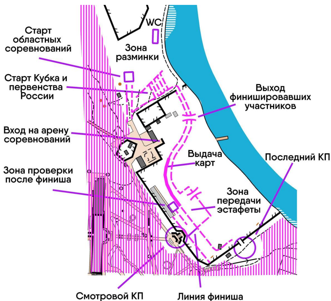
Схема арены 04.11.2018г. (кросс-эстафета-4 человека)