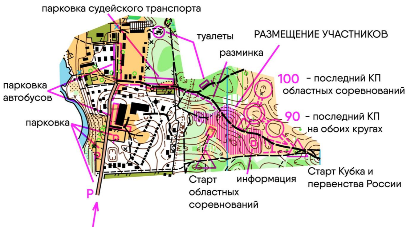
Схема арены 03.11.2018г. (кросс-классика-общий старт)