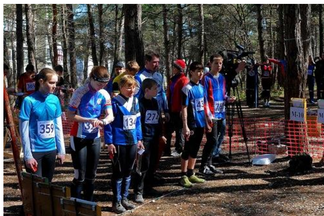
Черное море, г-к Геленджик, март 2013г.