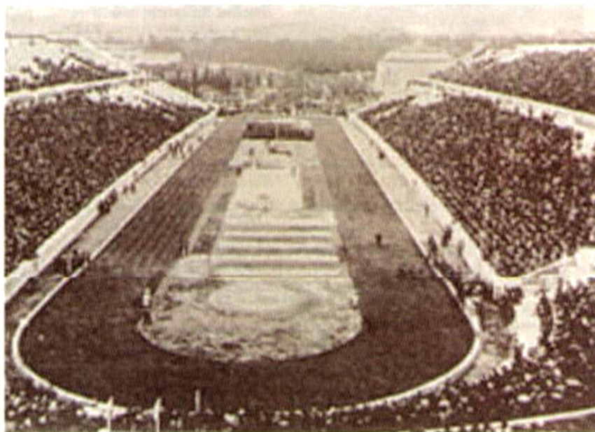
Стадион первых Олимпийских игр

Олимпийское движение можно представить себе в виде высокого и