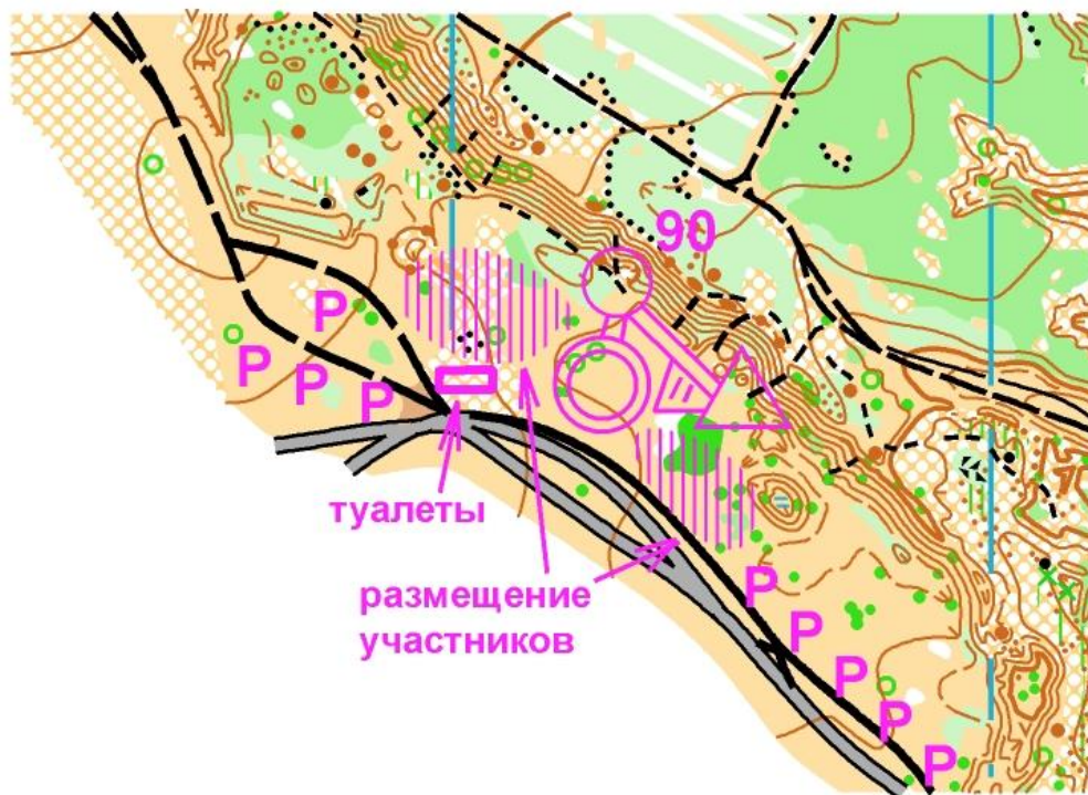
Схема арены 3 дня соревнований